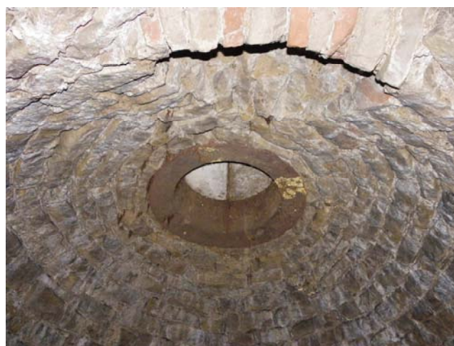
La partie supérieure de la glacière avec la margelle donnant sur l'extérieure.